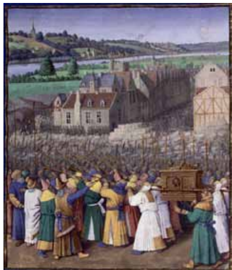
Bitwa pod Jerychem

Pawłowice. Partie śpiewane przeplatane były osobiście dobranymi recytacjami, były śpiewy solowe naszej P. Dyrygent, a rytm bębna wytwarzał jerozolimski klimat. Nawet 10-tki różańca podkreślone kanonami zyskiwały na duchowości. Cała godzina śpiewania, codziennie, przez siedem dni. Nas samych zdumiewała ta wielka samodyscyplina, ta chęć śpiewania, a nikt nikogo nie namawiał. Przyzwyczailiśmy się do wieczornego koncertowania – teraz pozostała tęsknota, jakieś uczucie pustki, żal za tak pięknie przeżytym czasem.