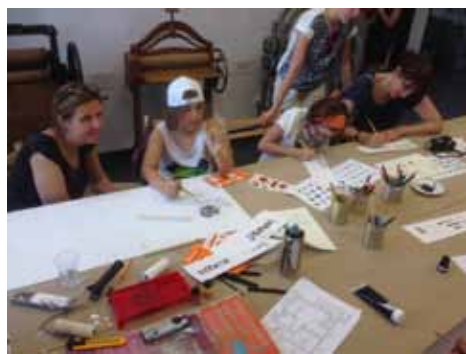
Prace graficzne z pralni w Nikiszowcu

Podczas naszej wycieczki nie mogło również zabraknąć odwiedzin Nikiszowca, dzielnicy górniczej zbudowanej przez właściciela kopalni dla jej pracowników na początku XX wieku. Górnicze miasto powstało w okresie kilku lat. Nazwa osiedla pochodzi od położonego w jego pobliżu szybu „Nikischschacht” (obecnie Poniatowski) i jest spolszczoną wersją jego niemieckiej nazwy.