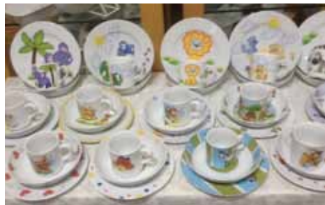
Porcelanowy serwis dla dzieci

Następnie, ze względu na nasze piękne panie, poszliśmy do funkcjonującej fabryki porcelany w Katowicach. Na terenie wybranych hal był zorganizowany jarmark wyrobów porcelanowych i nie tylko. Były tam malowidła, korale, książki i dania kuchni śląskiej – jednym słowem duch Śląska krążył wokół nas i wchodził nawet do żołądka. Nie zabrakło też wyprzedaży wyrobów porcelanowych fabryki, gdzie zakupiliśmy nawet piękne talerze czy salaterki porcelanowe po... 4 złote – trudno było się oprzeć pięknu i technice polskich wyrobów porcelanowych.