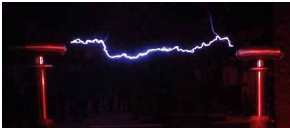
Trzymetrowa „grająca” iskra elektryczna wytworzona dzięki transformatorom Tesli „własnej” konstrukcji.

Obecnie osiedle jest w pełni zamieszkałe przez mieszkańców Katowic, posiada restauracje, sklepy... Chodząc po Nikiszowcu czuliśmy się jak 100 lat temu. W piekarni kupiliśmy nawet chleb czy pączki z różą, które smakują jak za dawnych czasów. Pomimo starego miasta, w rynku była jednak wystawa Kopernika, która pozwoliła dzieciom na wykonywanie eksperymentów „przeszłości”, testować refleks przy łapaniu jajek czy rzucanie do celu, patrząc przez „okulary”, które zamieniały stronę prawą na lewą – cel, który był widziany po prawej stronie