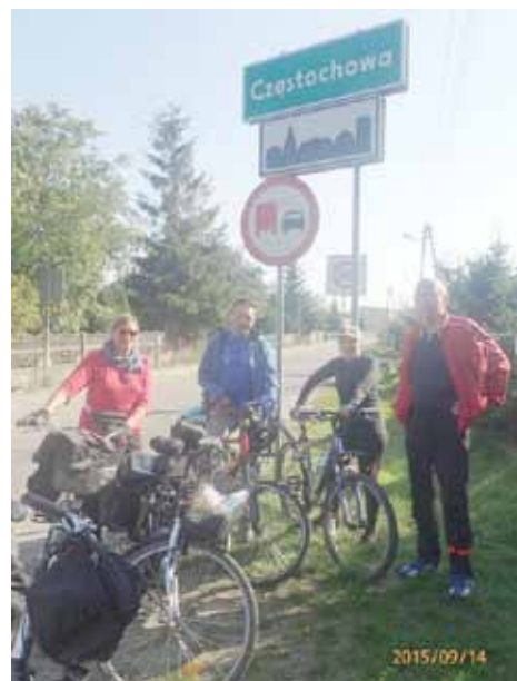
Wjazd do Częstochowy

Trzeci dzień zaczął się bardzo wcześnie. Chcieliśmy dojechać na Jasną Górę przed godziną 11:00, ponieważ o tej godzinie odprawiana jest msza święta w Kaplicy Cudownego Obrazu. Opuściliśmy gościnną kwaterę o 4:45 i pierwsze kilkanaście kilometrów pokonałszy w ciemności. Kierowaliśmy się drogą wojewódzką w stronę Częstochowy. Tempo było dość szybkie i prawie nie robiliśmy postojów. Na rzece Liswarce przejechaliśmy przedwojenną granicę polsko-