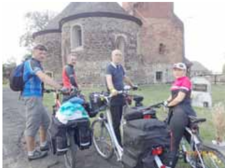
Przed kościołem w Stroni k. Bierutowa

spacerze po centrum miasta oraz sieciowych zakupach udaliśmy się na wieczorny spoczynek. Pierwszego dnia przejechaliśmy ok. 90 km.