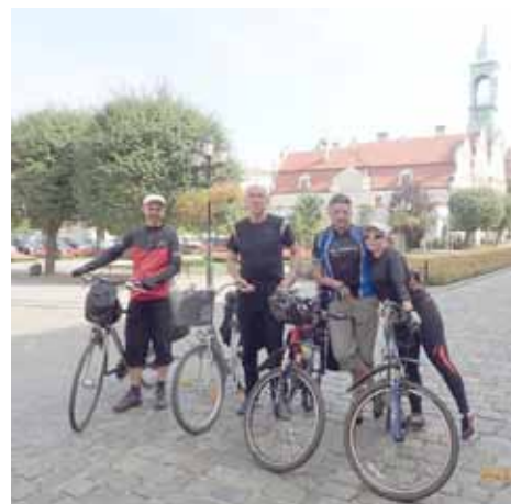
Na rynku w Kluczborku

cego tam źródła. Wspomniany pobliski kościół pielgrzymkowy pw. Św. Anny do bardzo ciekawa, drewniana budowla z dobudowanymi sześcioma kaplicami, które układają się w kształt gwiazdy. Kościół był niestety zamknięty, ale mieliśmy okazję dłużej odpocząć pod jego podcieniami. Jest to miejsce licznie odwiedzane przez miejscową ludność, a kościół jest miejscem postojowym na trasie śląskich pielgrzymek do sanktuarium na Górze Św. Anny. Do Olesna dotarliśmy późnym popołudniem, gdzie znów czekały na nas pokoje gościnne u strażaków. Po zakwaterowaniu udaliśmy się na pielgrzymi posiłek, a następnie na spacer po mieście, który zakończyliśmy na rynku. Tu przyglądaliśmy się ciekawie oświetlonej fontannie. Tego dnia, mimo przejechania tylko 70 km, wszyscy byli dość zmęczeni. Może dopadł nas kryzys drugiego dnia?