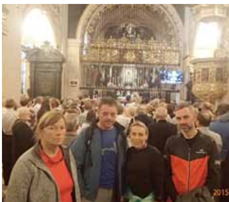
W Kaplicy Cudownego Obrazu

Osiągnęliśmy cel naszej pielgrzymki. Msza w Kaplicy Cudownego Obrazu zawsze jest przeży- ciem wzruszającym i każdy z nas przeżywał ją we własnym wnętrzu, ofiarując Czarnej Madonnie to wszystko, z czym do niej przyjechał.