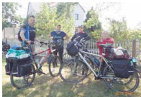
Odpoczynek w Dobrzeniu k. Oleśnicy

Pielgrzymom sprzyjała nie tylko pogoda, wręcz idealna do rowerowych podróży. Wyjeżdżając nie spodziewaliśmy się, że pielgrzymka będzie obfitować w różne nieplanowane, ale pozytywne zdarzenia. Trasa wiodła początkowo bocznymi drogami, na których ruch był niewielki. Powolne tempo pielgrzymki pozwalało na podziwianie malowniczych krajobrazów – wzgórz, lasów, łąk i pól oraz oglądanie mijanych miejscowości. Postoje robiliśmy w miejscach, gdzie zatrzymywała się pielgrzymka piesza oraz przy mijanych kościołach. Wrzesień to czas dożynek, więc w wielu miejscowościach była okazja, aby krótko pomodlić się w kościołach, które zwykle są zamknięte. Mieliśmy to szczęście, że przejeżdżając przez wioski często trafialiśmy na msze dożynkowe lub odpusty parafialne. Tym sposobem udało się nam zwiedzić m.in. kościółek-rotundę pw. Narodzenia NMP z 1250 r. w Stroni koło Bierutowa, który jako jeden z nielicznych przykładów architektury romańskiej w Polsce wymieniany jest w każdym podręczniku tej sztuki, także szachulcowy kościół pw. Św. Jacka z 1720 r. w Wierzbicy Górnej czy drewniany kościół pw. Św. Marii Magdaleny z 1680 r. w Starym Oleśnie, gdzie uczestniczyliśmy w niedzielnej mszy świętej i – jako pielgrzymi, jak każdy miejscowy gospodarz – zostaliśmy obdarowani chlebem dożynkowym. W kilku miejscach spotkaliśmy się z ludzką życzliwością, ale z większości zaproszeń, z racji ograniczonego czasu, nie mogliśmy skorzystać.