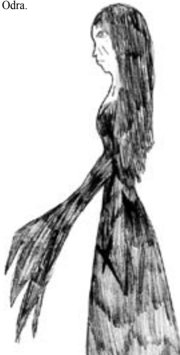
rys. Pola Marciniak

– Wyjdź z wody, proszę. Pokażę ci świat – powiedział Rufus zaciekawiony reakcją Odry.