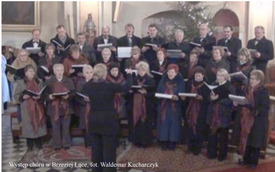
Występ chóru w Brzeziej Łące