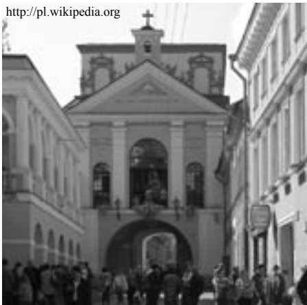
Kaplica Ostrobramska, za nią widoczna Ostra Brama. Widok od strony starówki.

Świadomość, że tych Kresów nie ma już w granicach Polski, miałem od małego. Od Mamy wiedziałem sporo o Lwowie i Ukrainie, bo gościła tam przed wojną i zachwycała się zarówno pięknem Kresów południowej Polski, jak i mentalnością zamieszkałych tam Polaków. Może dlatego tak mocno zaprzyjaźniła się z rodziną repatriowaną ze Lwowa, naszymi sąsiadami. A my – młodzi – z ich dziećmi, które, niestety, nie mówiły już tak śpiewnie i pięknie, jak ich rodzice i dziadkowie. Mam „foniczne” ucho i natychmiast wychwytyuję w mowie (dziś głównie ludzi starszych) ich kresowe pochodzenie.