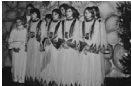
Schola dziecięca, Wieczór Kolęd, styczeń 1978 r.

bom dużo czasu, a jako dzieci dawałyśmy z siebie bardzo wiele. Nasz dyrygent wkładał w to dzieło również wiele serca i zapału. Ile było dziecięcej radości, gdy na konkursach chórów franciszkańskich na Górze Świętej Anny zajmowaliśmy wysokie miejsca.